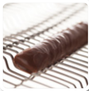
Cinta de entramado de varillas con cavidades