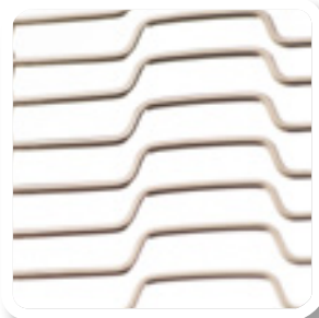
Cinta de entramado de varillas con protuberancias planas en horizontal