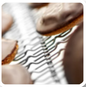
Cinta de entramado de varillas con picos

Para transportar los productos bien alineados (p. ej., para alinear productos rectangulares)